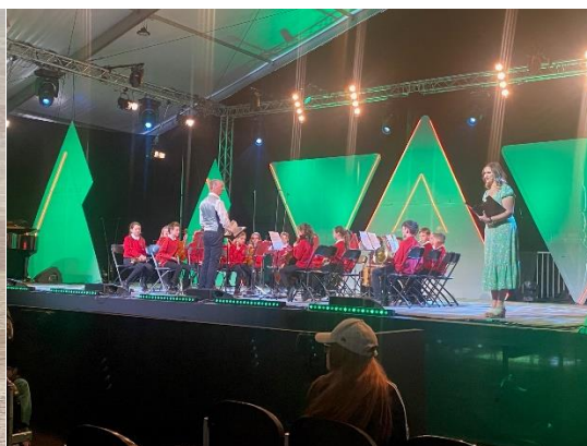
2nd - Orchestra

I would like to sincerely thank all the parents and families who travelled to Meifod this year. We appreciate your commitment to ensure that the children were there on time, in costume, and ready to perform. We also understand that the cost of attending the Eisteddfod was expensive for you – and although the school paid for the pupils' tickets, the cost for adults and families etc to come and support fell on your shoulders, and for that we are very grateful.