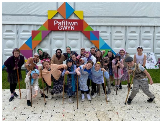
1st – Multi-media dance