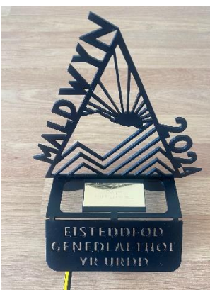
1st – Cân Actol