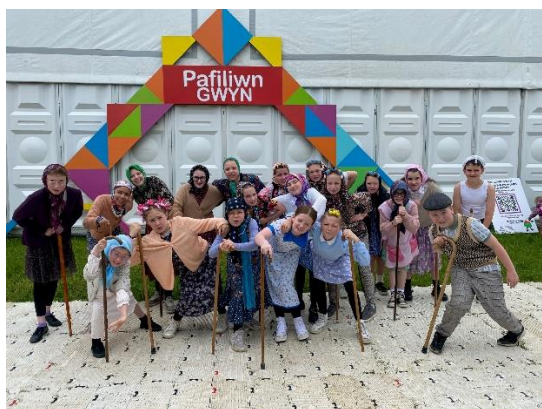
1af – Dawns Aml-gyfrwng