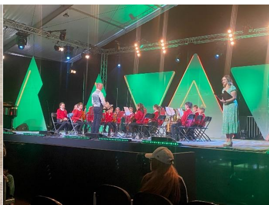
2ail - Cerddorfa

Hoffwn ddiolch yn ddiffuant am gefnogaeth yr holl rieni a theluoedd a deithiodd i Meifod eleni. Gwerthfawrogwn eich ymrwymiad i sicrhau fod y plant yno ar amser, mewn gwisg, ac yn barod i berfformio. Deallwn hefyd fod y gost o fynychu'r Eisteddfod yn ddruod – er i'r ysgol dalu am docynnau'r disgyblion, roedd y gost fesul oedolyn neu deuluoedd ac ati yn disgyn ar eich hysgwyddau chi, ac am hynny rydym yn ddiolchgar i chi am ein cefnogi.